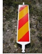
Juhatusmärk (ohulik koht või teeäär) „686a/686b“